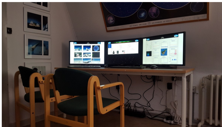
SONG kontrolrummet på Ole Rømer-Observatoriet

På Ole Rømer-Observatoriet har vi indrettet et kontrolrum, hvor max 3-4 personer ad gangen kan taste observationer ind og følge forløbet, når selve teleskopet observerer fra bjergtoppen på Tenerife. I andre lokaler på observatoriet er der plads til de fra klassen, som ikke aktuelt er i gang med observationer i kontrolrummet.